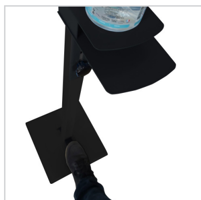
Commande au pied