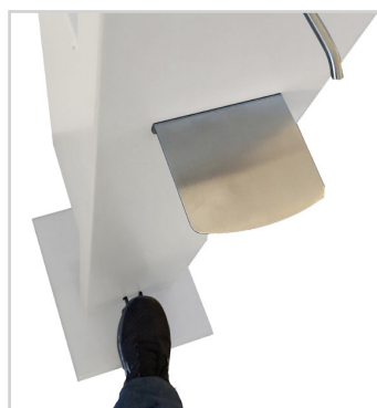
Commande au pied