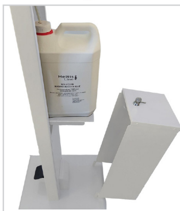
Grande autonomie avec bidon de 5 L