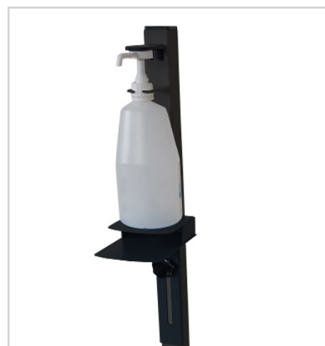
Compatible 1 Litre